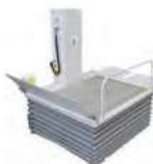
テクノリフター ※写真は045SS